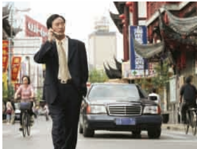
La forte demande des pays d'Asie maintiendra les cours des marchandises à des niveaux élevés.

Toute baisse de régime de la croissance américaine sera ressentie dans les autres pays. La baisse de la demande aux États-Unis modérera les exportations internationales et freinera la croissance économique