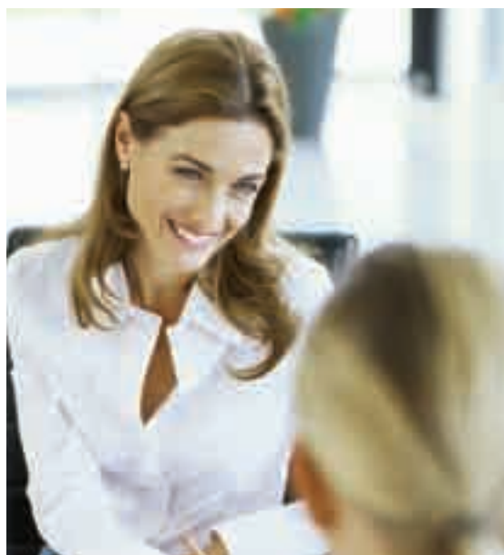
Le passage à l'imagerie de chèques sera avantageux pour vos clients et vous.

Sécurité accrue. L'accélération de la compensation améliorera la sécurité. Ainsi, vous recevrez les renseignements relatifs aux chèques plus rapidement et pourrez détecter les anomalies plus tôt.